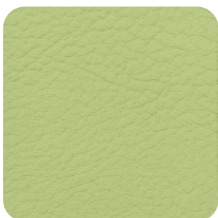
E - 02