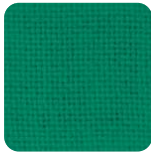
T - 17