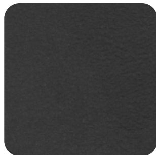
T - 09