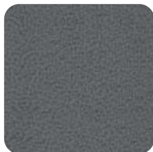
T - 34