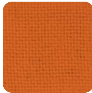
T - 18