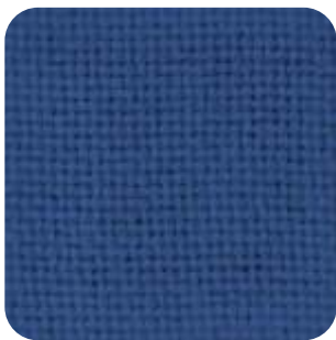
T - 21