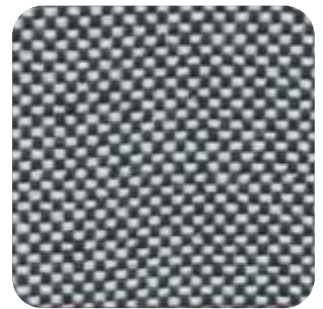
T - 19