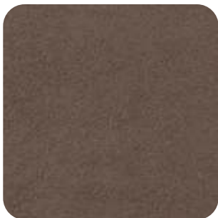
T - 08