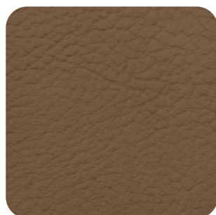
E - 04