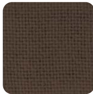
T - 23