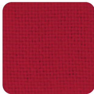
T - 22