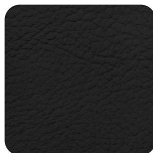
E - 05