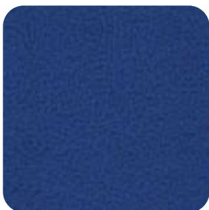
T - 33