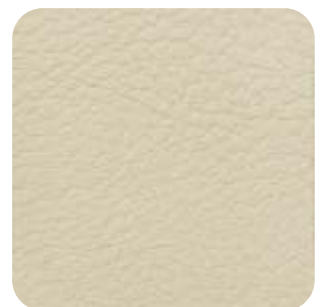
E - 01