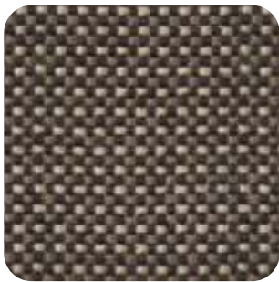
T - 10