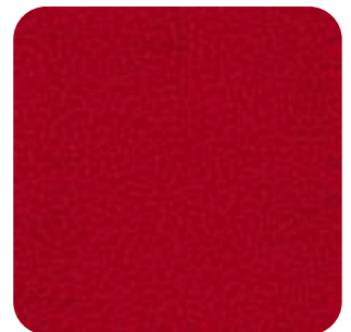
T - 32