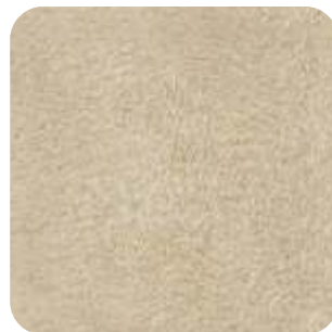
T - 31