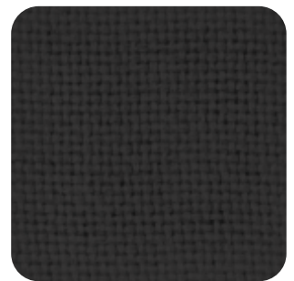
T - 24